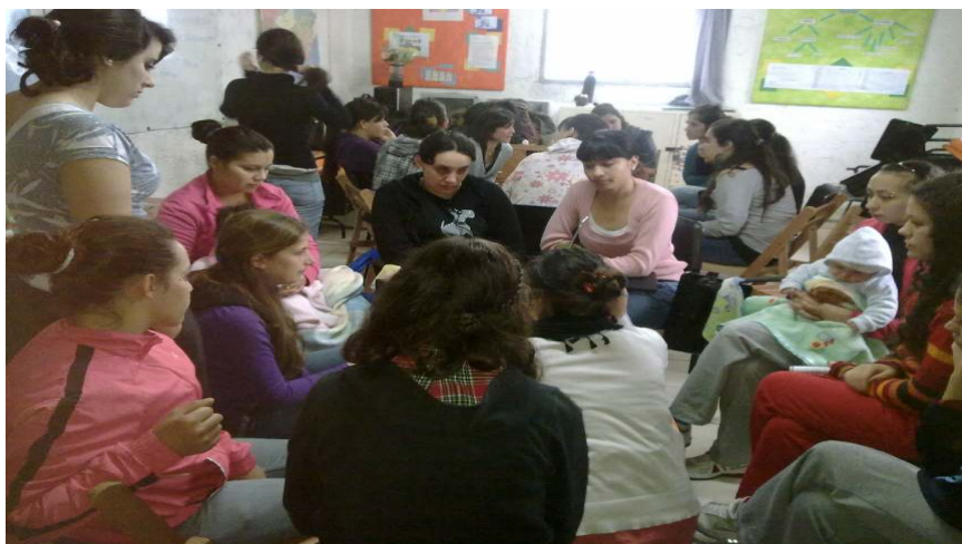
Figura 4: Estudiantes de la UdelaR e Internas de "El Molino" construyen colectivamente el plan de trabajo.

El siguiente enfoque se centra en las actividades desarrolladas por la UdelaR – FDC. La propuesta consistió en aprender a trabajar en un ámbito que contribuya a formarnos como universitarios comprometidos con la sociedad de la cual formamos parte, aprender a aprender de los conocimientos de la comunidad, en un plano de igualdad con nuestros conocimientos en un diálogo horizontal y bidireccional. Todo lo enmarcamos en la promoción de derechos, en conocer las consecuencias psico-sociales de la inclusión y el acceso a las Tics en la Cárcel. Las modalidades, el contenido de la intervención y el plan de trabajo fueron construidas en conjunto y en acuerdo por todo el grupo, esto es los estudiantes universitarios, las internas y el docente orientador.