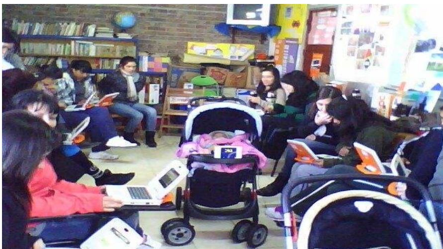
Figura 6: Trabajo con las XO con conexión a internet. Puede verse sobre el cochecito del bebé el router inalámbrico.

otra. Por último una tercera sección implicaba exploración de la XO de manera libre pero supervisada, lo que en torno al 90% implicaba navegación en internet.