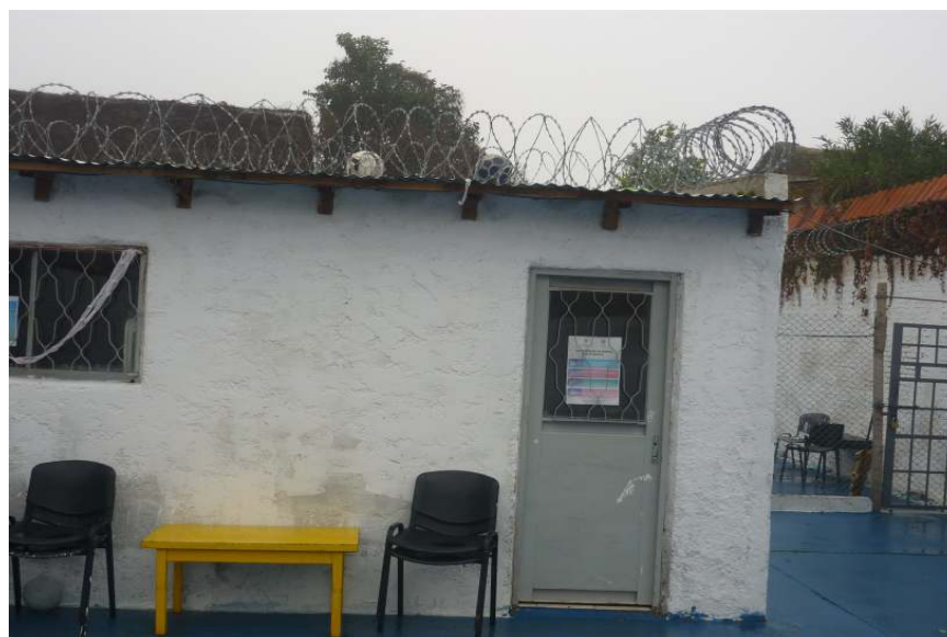
Figura 2: "La Escuelita"

El establecimiento cuenta con espacio físico destinado a la educación al que se refieren como "la escuelita", no tiene conectividad a internet por lo que utilizamos uno de los Router con que cuenta Flor de Ceibo.