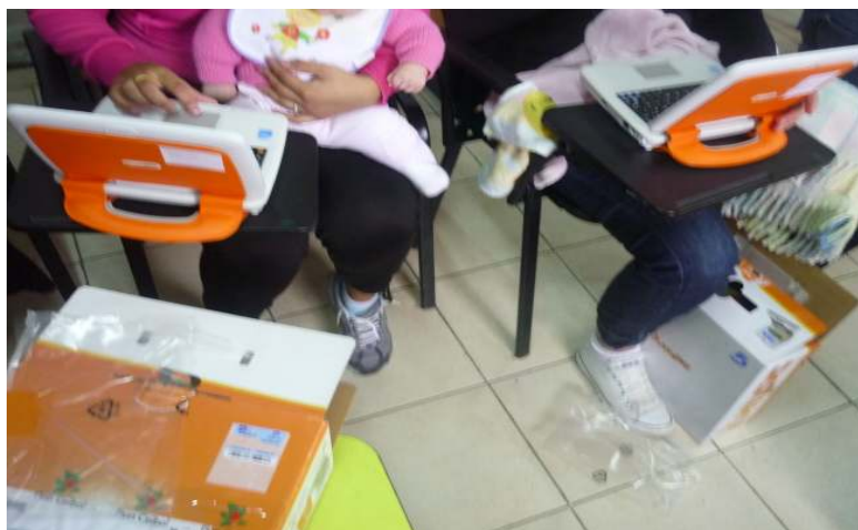
Figura 3: Olidatas del Plan CEIBAL disponibles en el establecimiento “El Molino”.

alrededor de 15 internas. Hubo un grupo de 8 o 9 que participaron desde junio a noviembre, en tanto que otras 6 o 7 participaron períodos acotados pero de manera regular en dichos períodos. La no participación tuvo múltiples causas, como ser salidas en libertad definitiva, actividades laborales fuera del establecimiento como por ejemplo en el programa “Barrido Otoñal” del Gobierno Departamental de Montevideo, traslados, entre otras.