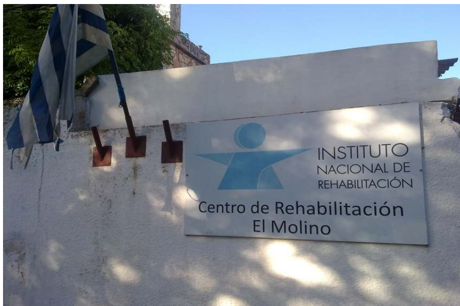
Figura 1: Fachada exterior del establecimiento