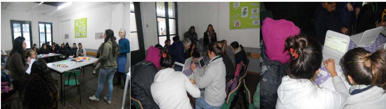
Ilustración 8: fotografía de instancias de taller en el CECAP.

del CECAP no habían recibido aún las computadoras de Plan Ceibal, coincidiendo la llegada de esta tecnología con los primeros talleres que se implementaron desde FDC.