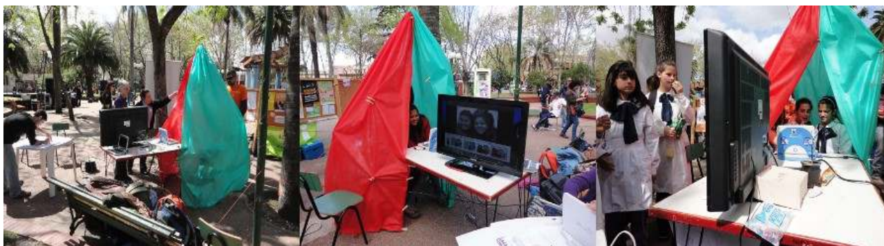
Ilustración 9: Actividad “Sacate la foto para la web de Flor de CECAP”. Flor de Ceibo en la Expo Educa Las Piedras.

En este momento se le plantearon las siguientes preguntas: