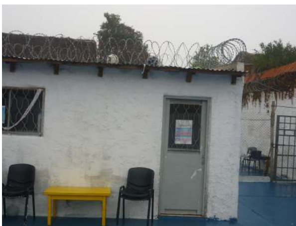
Ilustración 12: "La Escuelita"