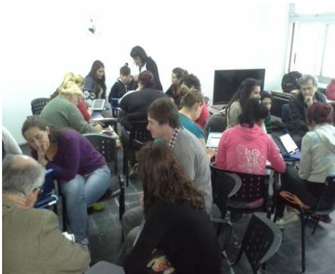
Ilustración 19: clase abierta de Biología