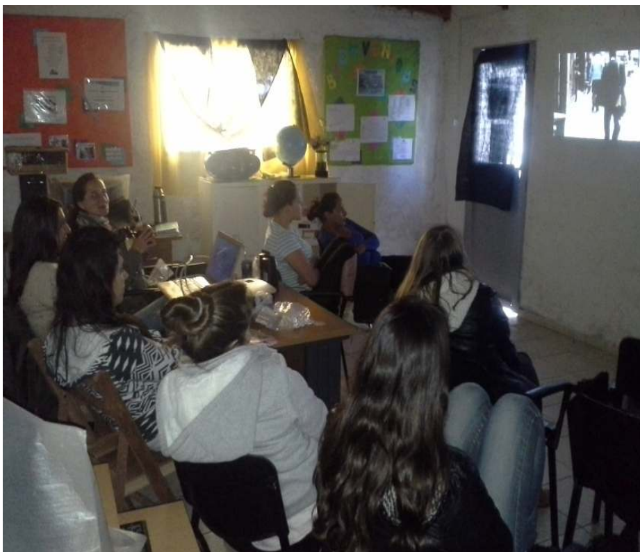
Imagen 10: Cine Foro

En igual forma, se destinaban espacios a la utilización de las XO, sea aprendiendo sus aplicaciones como un fin en sí mismo o aprendiendo a utilizar las aplicaciones de las XO (con o sin conexión a internet) para realizar una pauta de trabajo vinculada a la sección anterior u otra. Por último una última sección implicó exploración de la XO de manera libre pero supervisada.