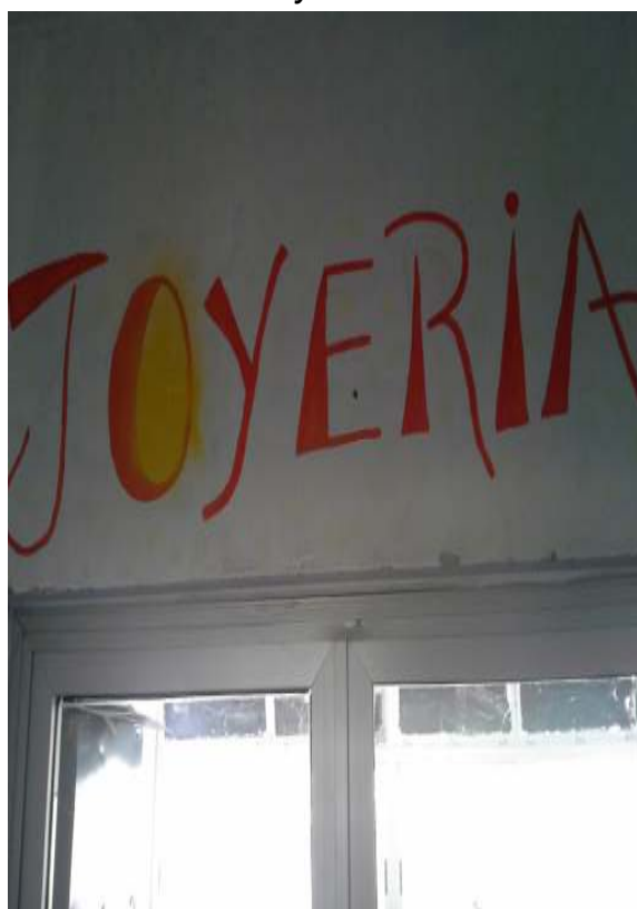
Ilustración 15: Puerta de ingreso al taller de Joyería